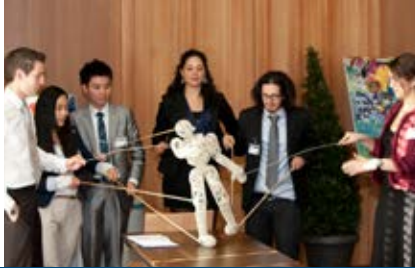
DUNDU Teambuilding, Stuttgart