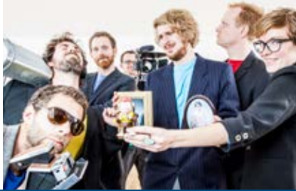
Affe im Kopf, München

„Affe im Kopf“ steht für inhaltliche Tiefe, mediale Breite und nachhaltige Wirkung. Die zehnköpfige Gruppe bietet crossmedialen Journalismus aus einer Hand. Durch ihre breite fachliche Aufstellung vom Medienpädagogen bis zum Architekten und vom Grafiker bis zum Kameramann können die zehn Kreativen flexibel auf alle möglichen Aufträge reagieren. So realisieren sie zum Beispiel Fernsehbeiträge für das ZDF, Sendungen für DRadio und ihre Texte erscheinen in der Süddeutschen Zeitung und der Zeit. Die Mitglieder wurden mit Preisen wie dem CNN Journalist Award, dem Umweltmedienpreis der Deutschen Umwelthilfe oder dem Ludwig-Erhardt-Förderpreis für Wirtschaftspublizistik ausgezeichnet. Langfristig wollen sie sich als Redaktionsbüro und Kreativschmiede etablieren und eigenständige Projekte