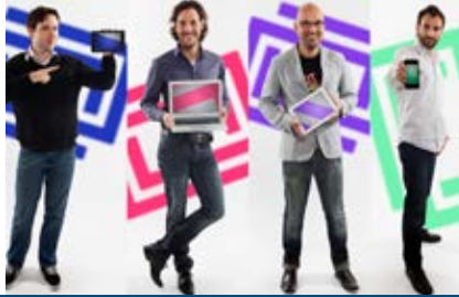
storyfeed GmbH, Berlin