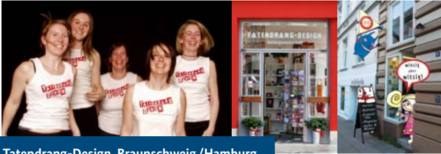
Tatendrang-Design, Braunschweig /Hamburg

» Wir wollen mit unserer Geschäftsidee eine größere Aufmerksamkeit erreichen und mit unseren Produkten eine breite Öffentlichkeit ansprechen. Gestaltung und handgemachte Illustration hat ihren Preis. Qualität, eine Produktion in Deutschland sowie nachhaltige Herstellung auch - dies wollen wir dem Kunden zukünftig kommunizieren.