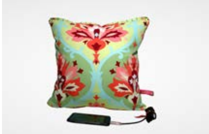
dashoerkissen GbR, Bremen