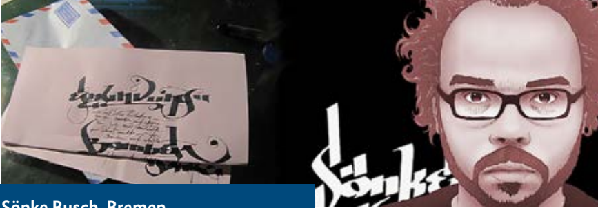
Sönke Busch, Bremen

» Die Auszeichnung des Kreativpiloten ist mir wichtig. Weil es interessant ist zu sehen, wie die anderen fliegen. Damit aus unseren ein-Mensch-Propellermaschinen ein großer bunter Vogel wird, der gesehen werden kann. Damit wir in dem Versuch gesehen werden können, wie gut das Leben sein kann, wenn man es selbst veranstaltet.