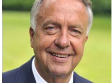
Bernd Neumann, MdB

Deutschland braucht seine kreativen Köpfe, denn Künstler und Kulturschaffende tragen erheblich zum Wohlstand und zur kulturellen Vielfalt des Landes bei. Dabei kommt der Kultur- und Kreativwirtschaft eine herausragende Bedeutung zu. Die Bundesregierung fördert sie durch die Initiative Kultur- und Kreativwirt-