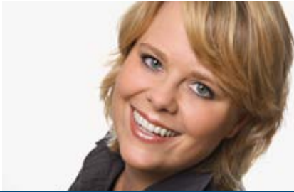
pageyou – Live eBooks, Hanau