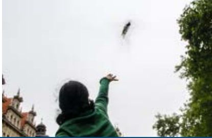
Sternschnuppen Wunsch Kit, Berlin