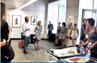
galerie module GbR, Dresden