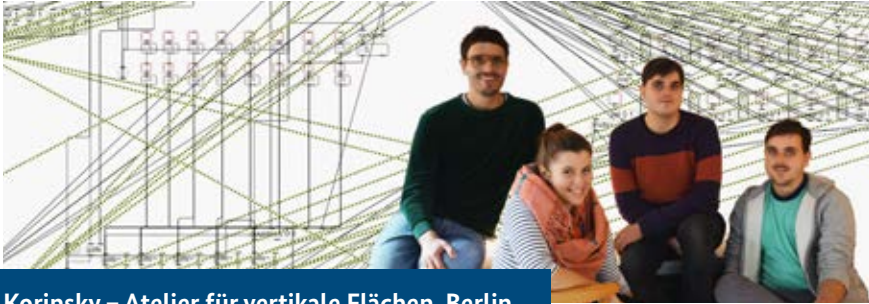
Korinsky – Atelier für vertikale Flächen, Berlin

» Lassen sich Kunst und eine Unternehmensgründung vereinbaren? Und wie positionieren wir uns richtig, um keinen dieser Aspekte aus den Augen zu verlieren? Ein Balanceakt zwischen künstlerischen Ansprüchen und Wirtschaftlichkeit – natürlich freuen wir uns da, dass uns professionelle Coaches mit Rat und Tat zur Seite stehen!